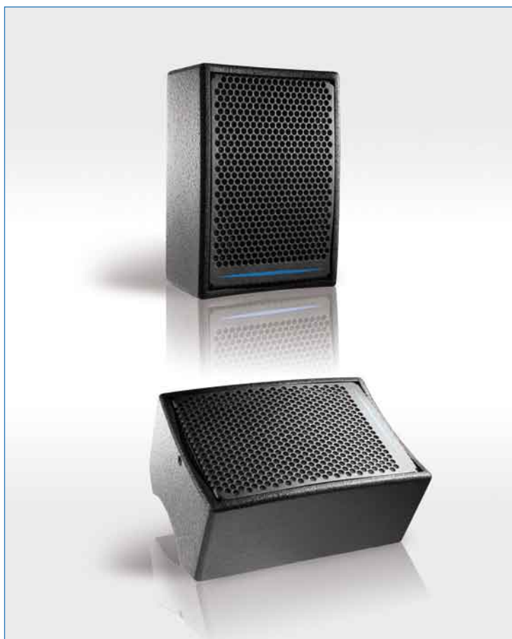
Enceinte DX5 présentée en façade et en retour

La DX5 est une mini enceinte satellite offrant une grande polyvalence entre tous les types d'écoute de proximité : retour de scène, diffusion répartie, contrôle d'écoute, complément de diffusion, façade avec ou sans renfort de grave. De par ses dimensions, la DX5 est destinée à la sonorisation des petites et moyennes surfaces ainsi qu'à la couverture répartie de grands espaces. Sa compacité et sa clarté sonore en font le produit idéal pour les applications où la discrétion doit être conjuguée à une qualité de restitution sonore élevée.