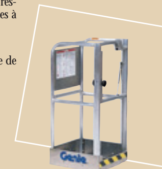
Nacelle ultra étroite avec portillon