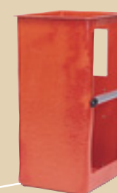
Nacelle étroite en fibre de verre