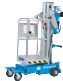
Base tout terrain

En plus du châssis standard, Genie vous propose de choisir parmi un châssis étroit et un châssis pour terrains difficiles. Les trois châssis sont disponibles sur les modèles suivants : AWP-20S, AWP-25S et AWP-30S. Les modèles AWP-36S et AWP-40S ne sont disponibles qu'en châssis standard.