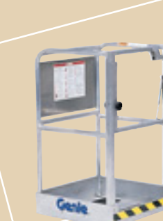
Nacelle standard avec portillon