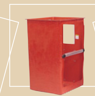
Nacelle standard en fibre de verre